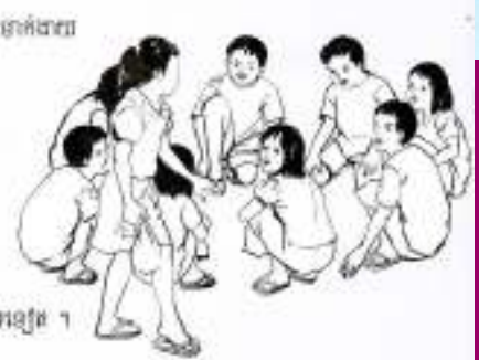
ការលេចពីសាក្តីកុមាររបស់កុមារក្នុងសហគមន៍