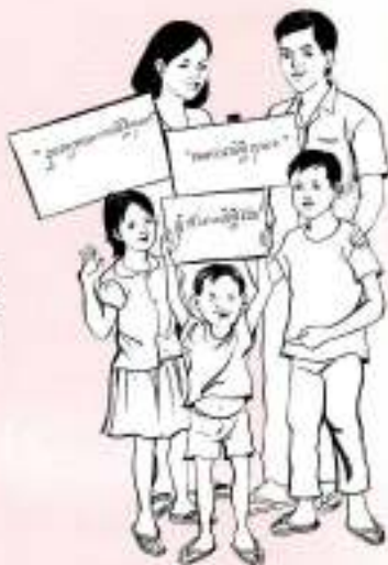
សិទ្ធិកុមារស្តីពីការពង្រឹងសិទ្ធិកុមារ

កម្មវិធីខាងលើនេះ គឺជាការពង្រឹង និងការពារសិទ្ធិកុមារ និងត្រូវធ្វើឱ្យគ្រូបង្រៀនដឹងពីការរារាំងចូលទៅនៃអនុសញ្ញារបស់អង្គការសហប្រជាជាតិស្តីពីសិទ្ធិកុមារ និងឱ្យគ្រូបង្រៀនដឹងពីការពង្រឹងសិទ្ធិកុមារនៅក្នុងសហគមន៍ក្រីក្រស្តីពីការប្រើប្រាស់សិទ្ធិកុមារ និងសេវាសង្គម និងការពង្រឹងសិទ្ធិកុមារ ។