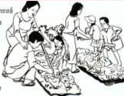
ក្រុមការងារប្រើប្រាស់សេវាសង្គមស្របតាមតម្រូវការរបស់កុមារ និងសេវាសង្គមស្របតាមតម្រូវការរបស់កុមារ